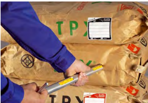
Abbildung 14.A-13 Bemusterung von Gebinden mittels Musterzuglanze