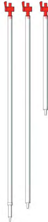
Abbildung 14.A-14 Stech- heber