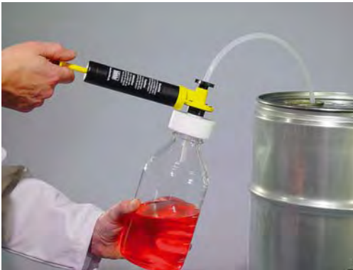
Abbildung 14.A-12 Beispiel einer Probenahme von Flüssigkeiten mittels Vakuumpumpe